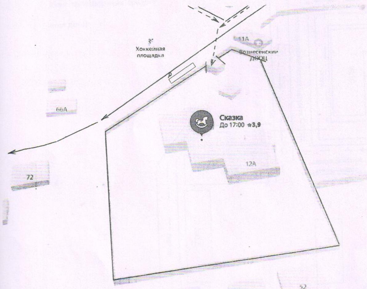
Схема организации дорожного движения в непосредственной близости от образовательной организации размещением соответствующих технических средств, маршруты движения детей и расположением парковочных мест